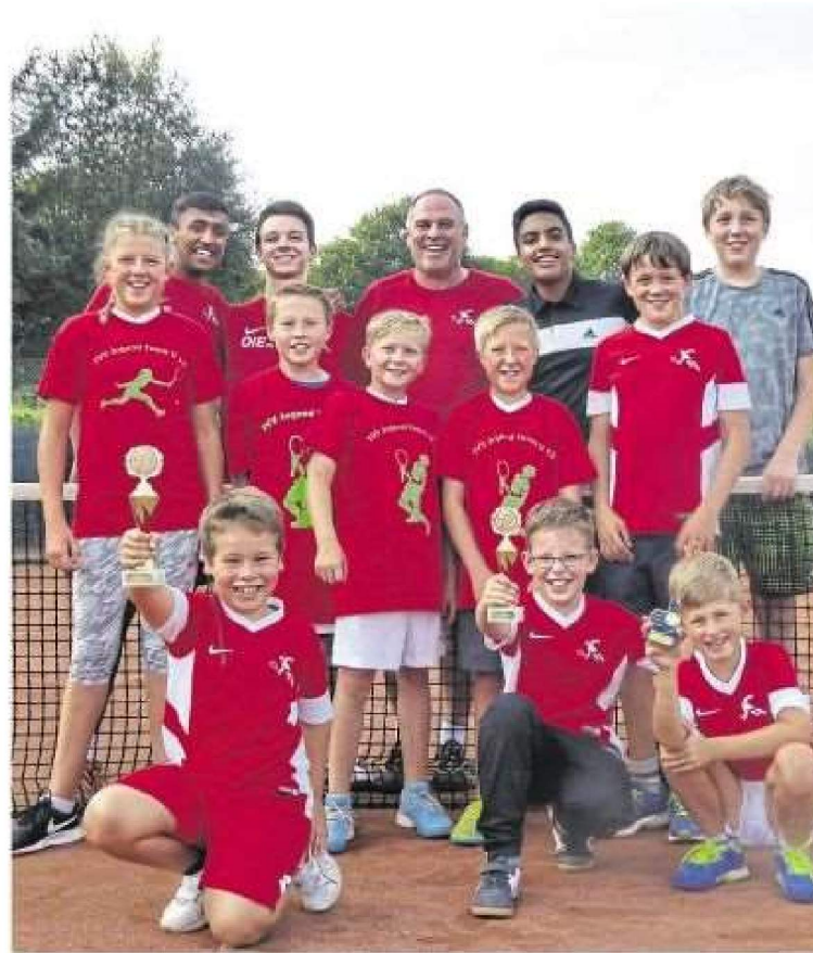
Jubelnder Tennish Nachwuchs bei den Vereinsmeisterschaften der Jugend in Vollmersbach