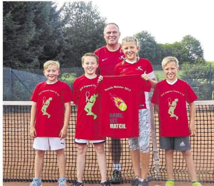
Viel Freude bereitete die gemischte Jugend U12 des TV Vollmersbach. Das Team sicherte sich souverän die Meisterschaft in der B-Klasse. Der Titel wurde sogar ohne Niederlage eingefahren.