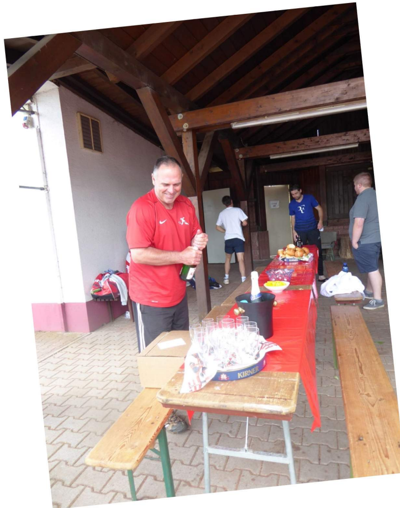
Ein Prosit auf die Meister!!

Meisterschaftsfeier der 1. Herrenmannschaft