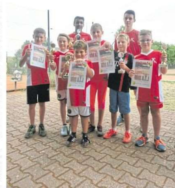
Die Vereinsmeister 2016 der Tennisabteilung des TV 1875 Vollmersbach zeigen Pokale und Urkunden.

➕ Weitere Informationen über die Tennisabteilung in Vollmersbach gibt es im Internet unter www.tv-vollmersbach.com oder beim Trainer Stephan Petsch unter der Telefonnummer 0170/187 02 98.