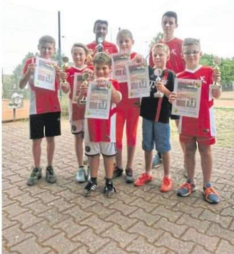
Die Vereinsmeister 2016 der Tennisabteilung des TV 1875 Vollmersbach zeigen Pokale und Urkunden.

Vollmersbacher Tennisabteilung kürt Jugendvereinsmeister 2016 - Debut der Jugend U 8